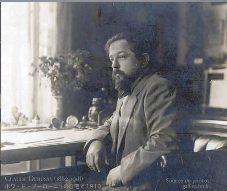
CLAUDE DEBUSSY (1862-1918) ボワ・ド・ブローニュの自宅で 1910